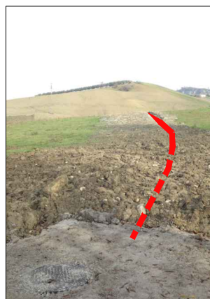
F.1: Collegamento fogna esistente con condotta a caduta in corrugato De315 - arrivo sollevamento