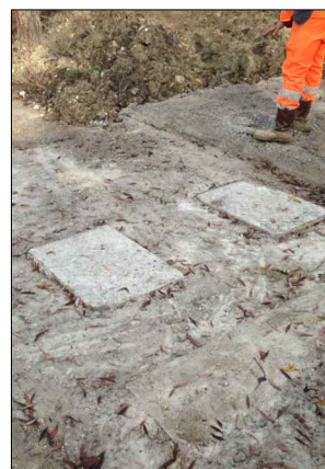
F.3: Sollevamento Ponte Maiella