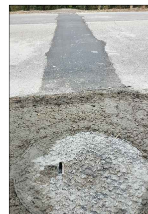
F.9: Pozzetto di disconnessione