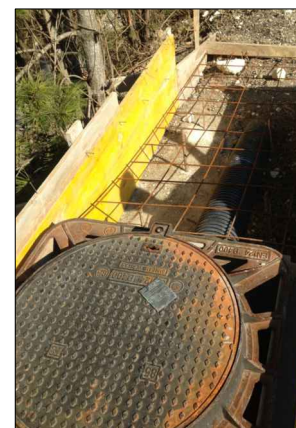
F.4: Arrivo condotto premente in pead su Ponte Maiella - pozzetto con sfiato