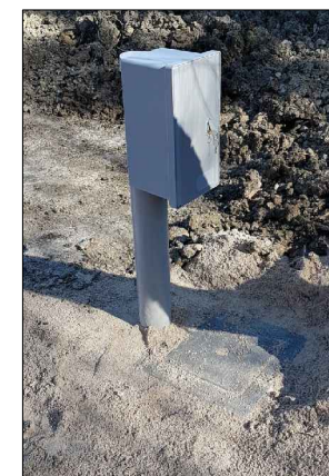
F.5: Cassetta elettrica impianto di sollevamento