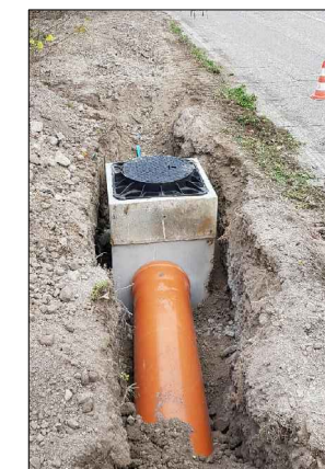
F.6: Tubo guaina in PVC Di500