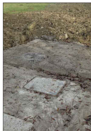
F.2: Sollevamento Ponte Maiella