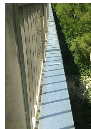
F.8: Carter di copertura condotta premente