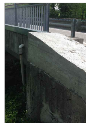
F.7: Disarmo punto di arrivo condotta premente dal Ponte Maiella alla banchina Strada Provinciale