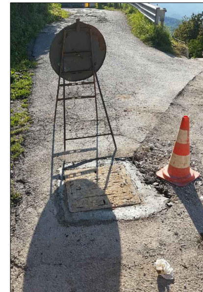
F.5: Pozzetto di arrivo fogna esistente