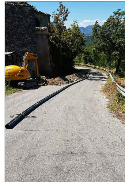
F.1: Posa condotta premente Pead De 125