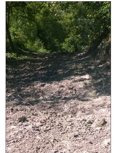
F.6: Ripristino scavo di posa condotta premente su campagna