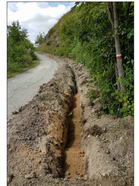
F.3: Posa condotta premente su banchina