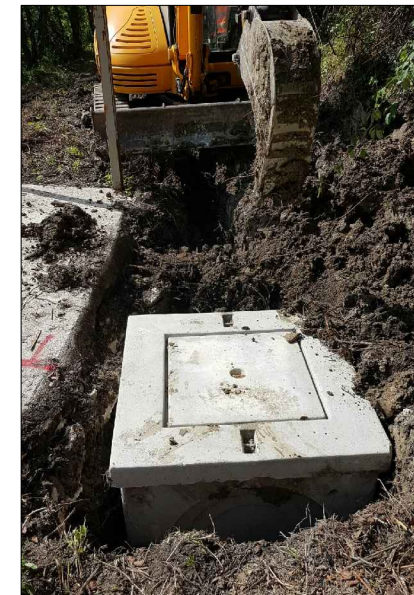
F.2: Posa pozzetto valvole - vasca di sollevamento