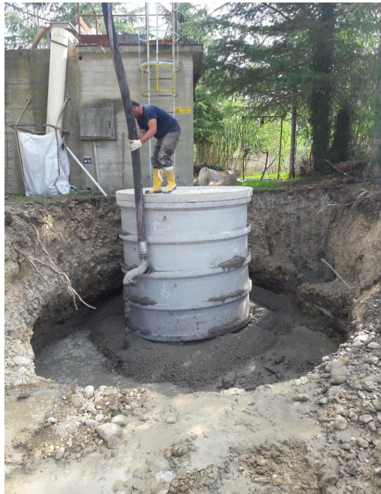
DEPURATORE REMARTELLO (LORETO APRUTINO)