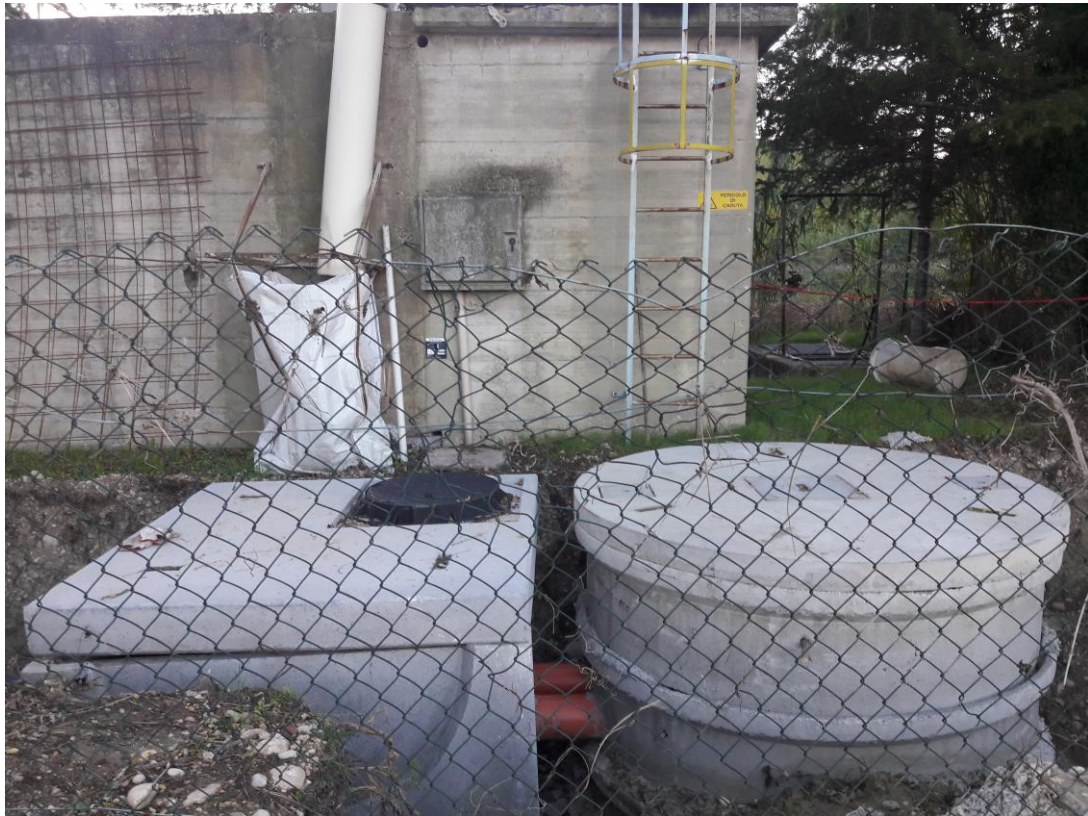
DEPURATORE REMARTELLO (LORETO APRUTINO)